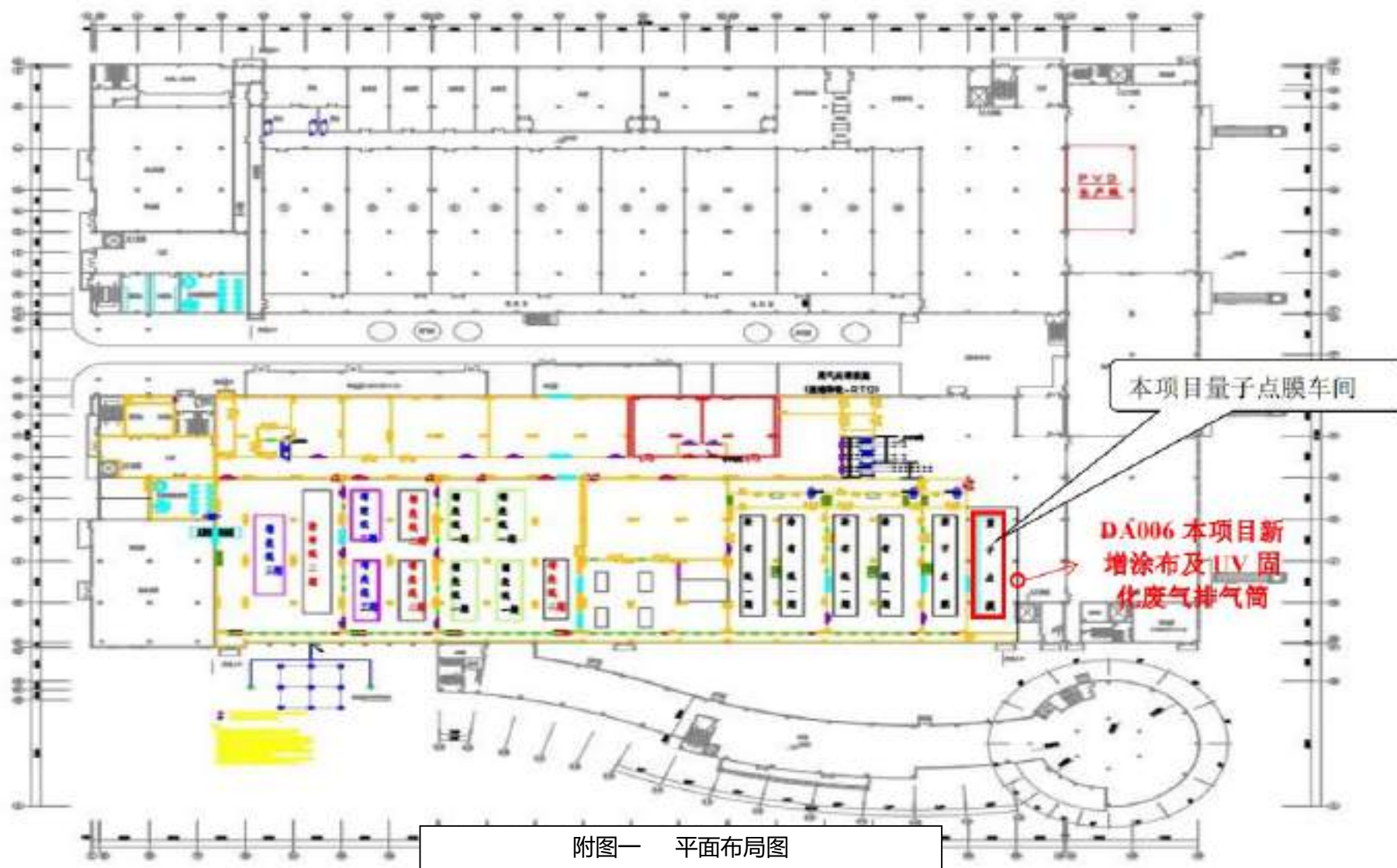
附图 1 平面布局图